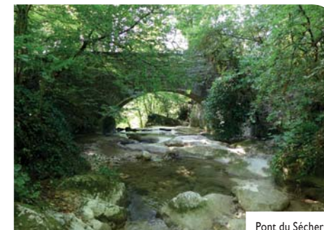
Pont du Sécheron