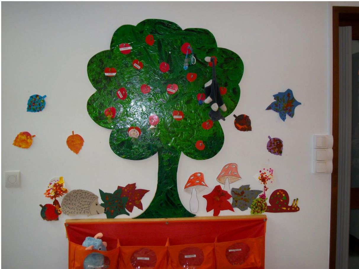
L'arbre à Tétines.

Elle est nécessaire pour certains enfants. Elle doit être notée au nom de l'enfant . Au cours de la journée, lorsque l'enfant ne l'utilise pas, elle est accrochée à « l'arbre à tétines ».