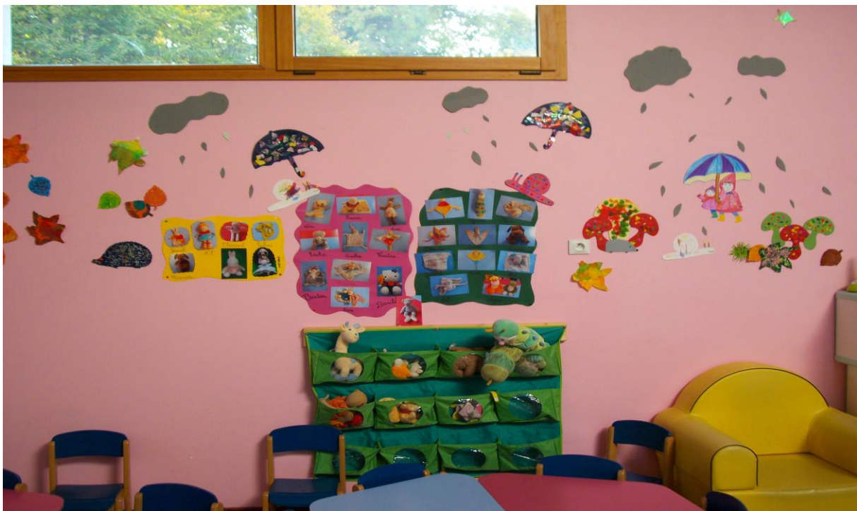
La pochette à doudous.

Les enfants ont très souvent besoin d'un objet transitionnel qui fasse le lien avec la maison (odeurs, sensations...).