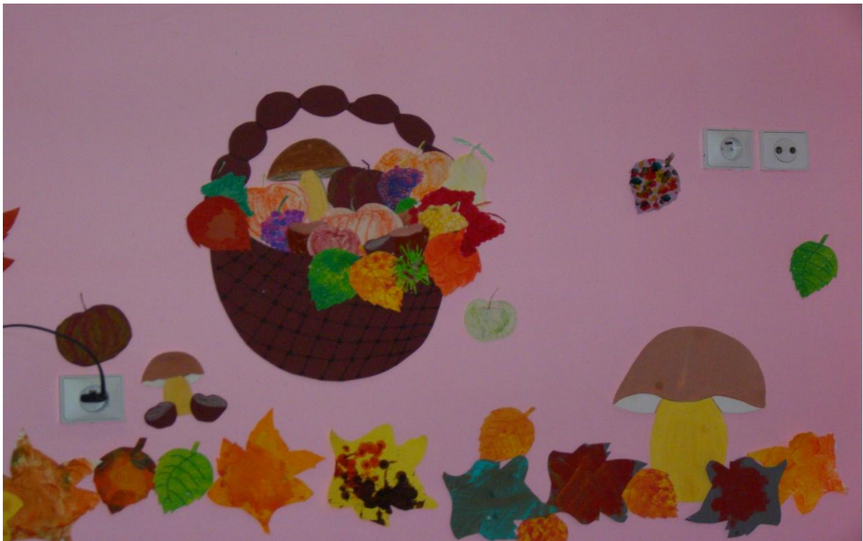
Les créations artistiques des enfants à Tom Pouce.

L'équipe propose régulièrement des activités manuelles aux enfants. Cela n'est jamais imposé. Les supports sont adaptés en fonction de chaque enfant (Feutres, crayons de couleur, peinture). Malgré toutes les précautions prises (Tabliers, peinture lavable), il peut arriver qu'un enfant se salisse !