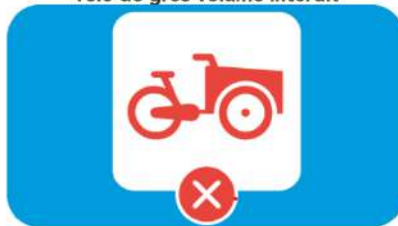
Vélo de gros volume interdit

L'embarquement de tricycles, fatbike, triporteur, tandems et cargos... est interdit à bord.